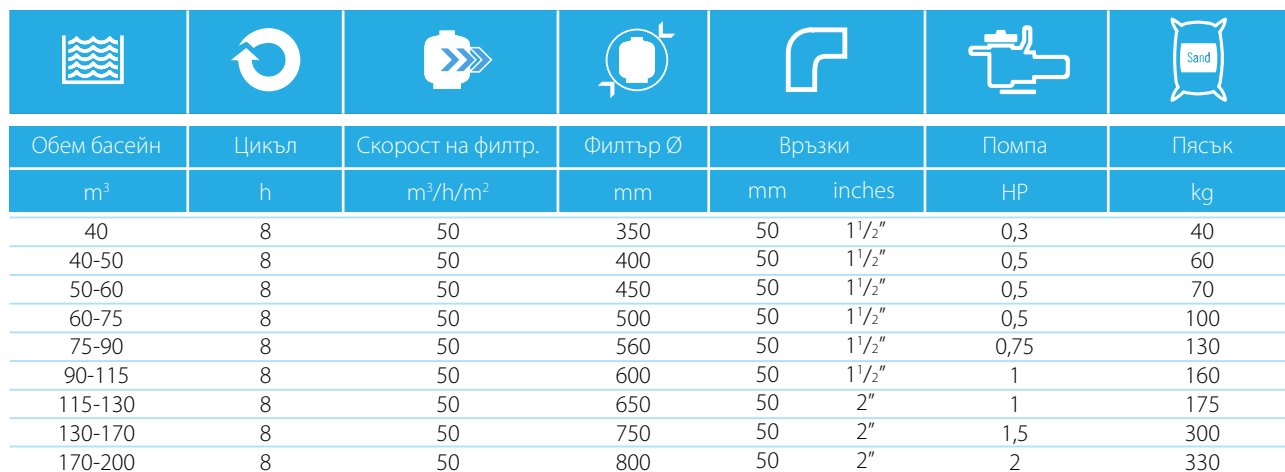
Таблица за избор на филтър и помпа